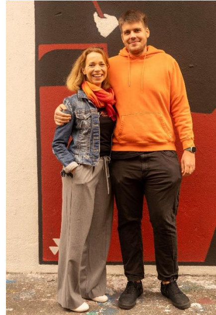
Harmonische Übergabe des Präsidiums

Mit der 35. Mitgliederversammlung im Mülo starten wir ins neue Vereinsjahr – und diesmal ist schnell klar: Es wird kein ganz normaler Abend.