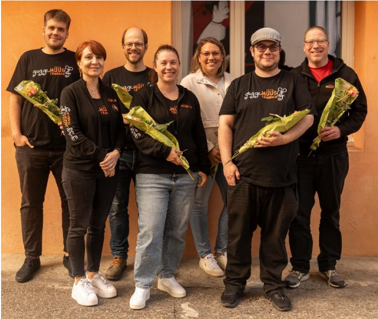
Vorstand 2025 – 2026